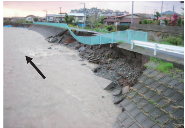
図－5 H25年災 第1号金目川被災箇所

この低気圧の降雨により、二級河川金目川において、災害が発生したもので、復旧延長42m、コンクリートブロック張り工381㎡を申請しました。この被災箇所は、平成24年災として災害復旧事業の施工箇所から約40m上流に位置しており、この40m区間も合わせて復旧工事を行いました。