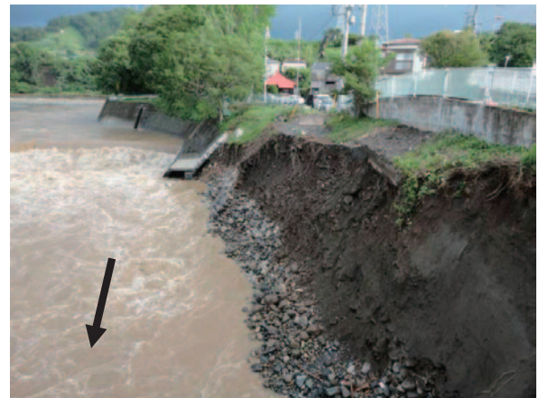
図-3 H24年災 第1号酒匂川被災箇所

第2号は、小田原市内における山王川において、 護岸工が被災したもので、復旧延長は42.0m、復旧 工法は、護岸工として、コンクリートブロック積 みを215㎡、根固め工として、ふとんかごを84m 申請しました。