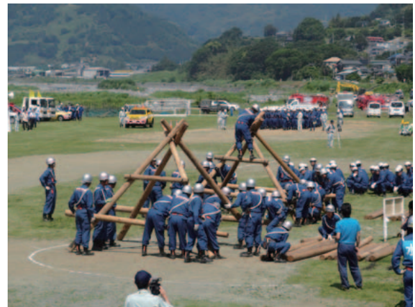
図-7 平成24年度の水防演習の様子