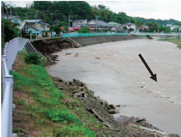
図－4 H24年災 第4号金目川被災箇所

第4号も同じく金目川であり、第3号から1.5kmほど下流に位置する、平塚市内における護岸工が被災したものであり、復旧延長は83m、復旧工法は、法覆護岸工として、コンクリートブロック張り工を757㎡、根固め工として根固めブロック103個を申請しました。