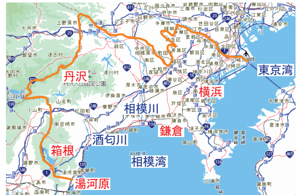
図-1 神奈川県の概要

かえ、東と南が平野と海に面し、また、太平洋の黒潮の影響を受けているため、温暖で雨量の多い太平洋側気候となっています。