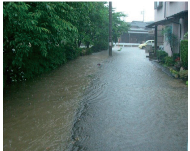
大田町橋北地区の浸水状況