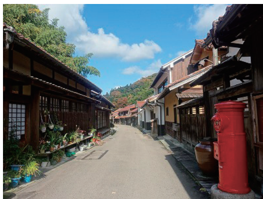
石見銀山遺跡 大森地区の町並み

2007年に世界遺産に登録された「石見銀山遺跡とその文化的景観」は、世界に轟いた高品質な銀の産出量と製錬技術、加えて自然と調和した文化的景観を有する鉱山として高く評価されています。