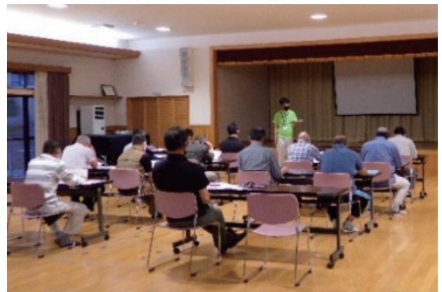
自治会での説明会の様子