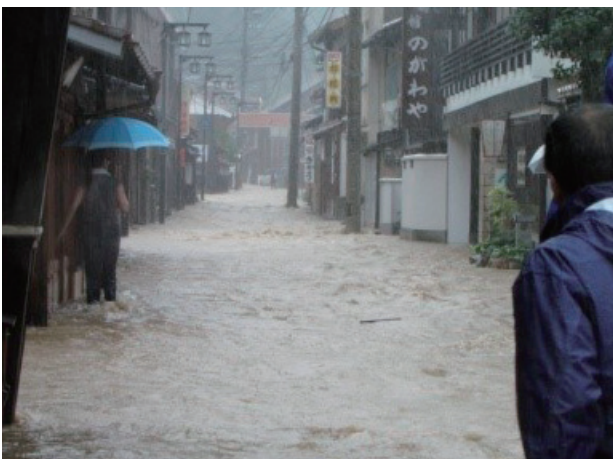
温泉津地区の浸水状況

また、整備を進めている大田町橋北地区は、降雨時の排水が集中する農業用水路から県河川への排水を新たに担うバイパスの整備を進めており、令和6年度の整備完了を目指しています。