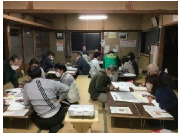
自主防災会主催の防災計画づくりの様子

そのほか、市内小・中学校、高等学校や児童クラブ、社会福祉施設でも、段ボールベッドや非常食づくり体験などの研修会を開催し、地域防災に関する知識の醸成と意識の向上に取り組んでいます。