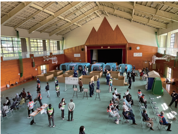
総合防災訓練の様子

訓練は2部構成とし、第1部では、地元住民による避難訓練、第2部では、自主防災組織と連携した避難所運営をはじめ、消防によるドローンを用いた被害状況調査、孤立地域での救助などの訓練をおこないました。中でも避難所運営訓練では、段ボールベッド、段ボール間仕切りなどを用いて実際の配置状況や利用方法を確認したほか、日本防災士会並びに市社会福祉協議会による防災講話、NTT西日本(西日本電信電話株式会社)による災害用伝言ダイヤル(171)の使用方法など、災害時に有益な情報取得方法の紹介をおこない、被災地域における実践的な対応を確認することができました。