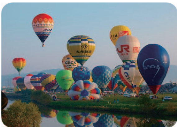
佐賀インターナショナルバルーンフェスタ

最後になりますが、緑豊かな自然環境、古代からの歴史・文化に恵まれた佐賀県にぜひ皆様お越しください。