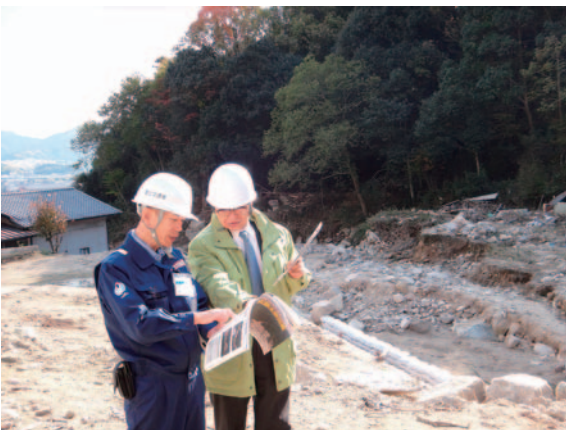
写真－2 安佐南区緑井において国土交通省担当官から説明