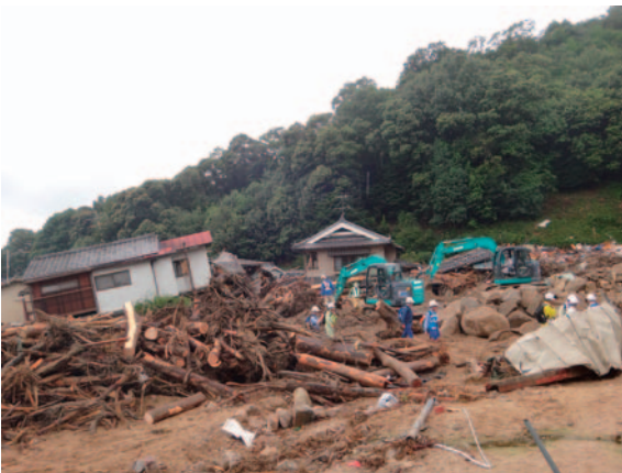
写真－1 安佐南区緑井（8月末撮影）