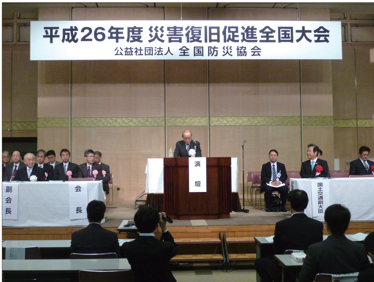
平成26年度災害復旧促進全国大会が11月27日に開催されました。本文は1月号に掲載予定