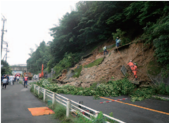
写真－1 武雄福富線 被災直後写真